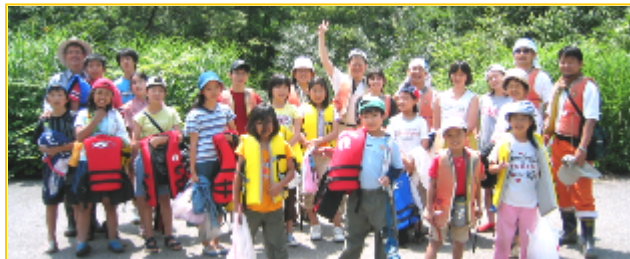
そつ。まずは何と言ってもキヤンプです。23日、月21日から、日本にパイプホルムで行なわれた小・中

今月の暗唱聖句 「人はパンだけで生きるのではなく、神の口から出る一つ一つのことばによる。」(マタイ 4章 4節)